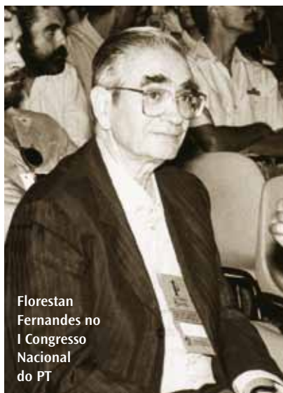
Florestan Fernandes no I Congresso Nacional do PT