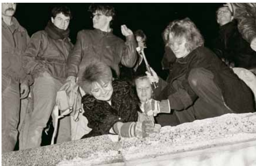
Alemães “derrubam” o muro após a abertura da fronteira da Alemanha Oriental, em 9 de novembro de 1989

refugiar-se nos velhos clássicos sobre a formação social brasileira, como Sérgio Buarque, Caio Prado Jr., Celso Furtado e Florestan Fernandes, procurando lá as respostas para os problemas e os desafios do capitalismo no mundo e no Brasil dos anos 1990. Desdenharam o fato de que tais problemas e desafios haviam se tornado, em seus aspectos principais, diferentes daqueles analisados na primeira metade do século 20.