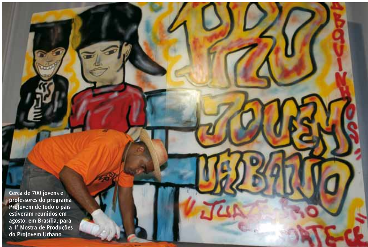
Cerca de 700 jovens e professores do programa Projovem de todo o país estiveram reunidos em agosto, em Brasília, para a 1ª Mostra de Produções do Projovem Urbano