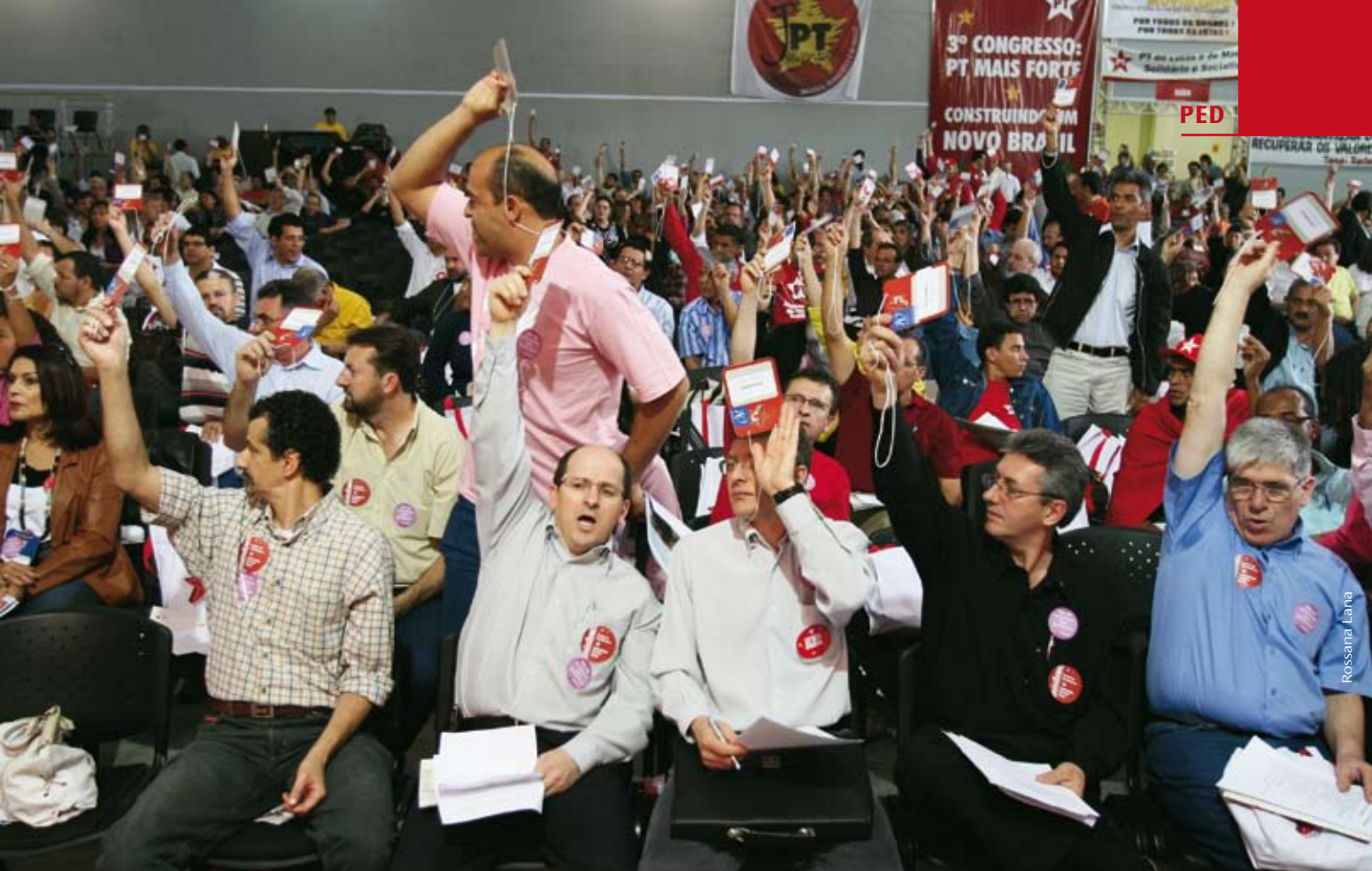
Nas propostas das chapas há discordâncias na tática eleitoral e no programa do PT para as eleições, mas unanimidade na candidatura de Dilma Rousseff

cabeça da chapa”. Esse último tópico é contestado explicitamente pelos proponentes da chapa “Partido para todos – Unidade na diversidade”, que advogam a necessidade de o partido ter “candidatos próprios nos estados onde há chances reais de vitória”.