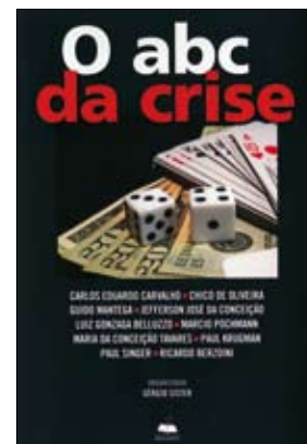
O ABC da Crise , Sérgio Sister (org.). Editora Fundação Perseu Abramo, 2009, 184 páginas

A coesão política do pensamento liberal-conservador dos economistas da Casa das Garças começa com o time de autores, todos do núcleo duro dos ortodoxos defensores da atual política econômica. A forma de organização do livro, a partir da localiza-