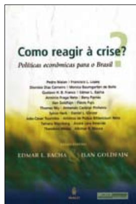
Como Reagir à Crise? Políticas Econômicas para o Brasil , Edmar Bacha e Ilan Goldfajn (orgs.). Imago Editora, 2009, 120 páginas

O ecletismo do diagnóstico da crise e as proposições de O ABC da Crise expressam a fragmentação do espectro político de seus colaboradores. O artigo-âncora do livro é o de Jefferson José da Conceição, que diagnóstica didaticamente a crise e lista proposições imediatas e de médio prazo para a defesa do emprego e de mudanças institucionais e de política econômica. Falta, porém, uma análise mais consistente e fundamentada. Em algumas passagens, por exemplo, são citados conhecidos economistas da ortodoxia liberal, como Jeffrey Sachs, o que acaba por confundir o leitor. As proposições de mudanças mais fortes, como o questionamento do atual tripé monetário-cam-